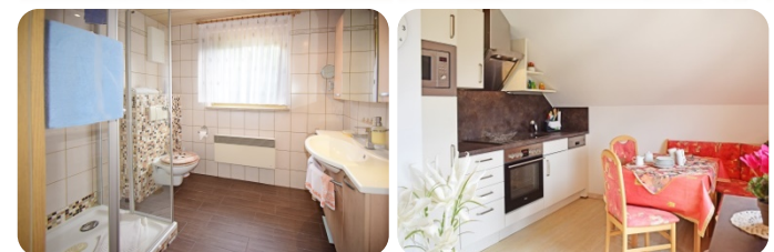
Küche mit Essgruppe